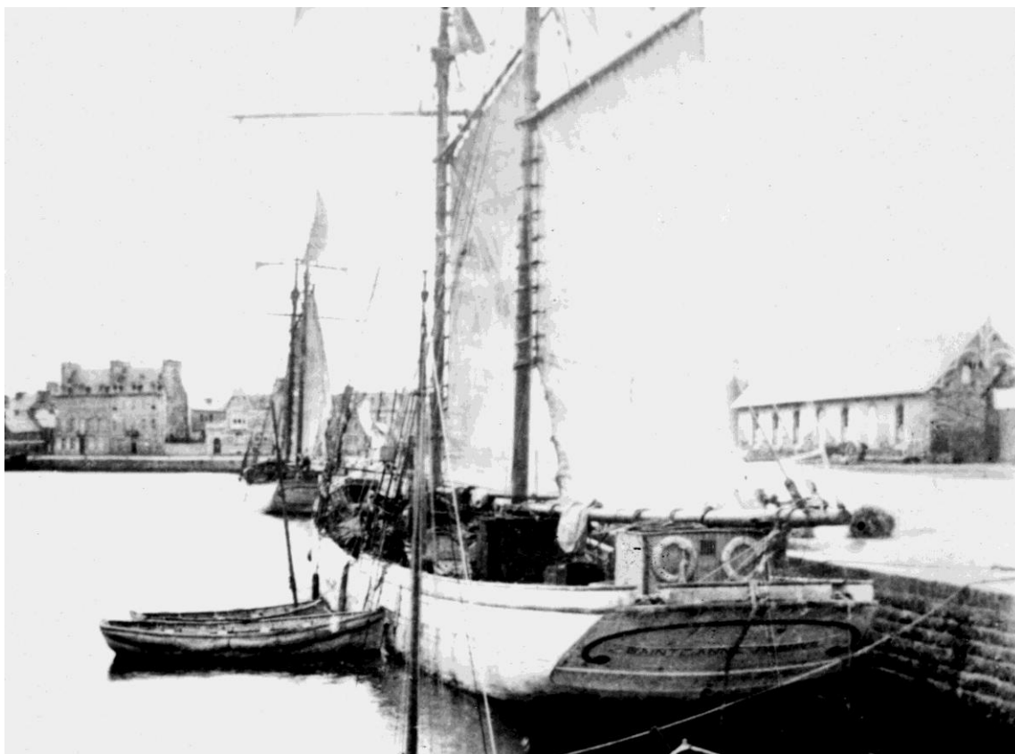
La goélette SAINTE ANNE dans le port de Paimpol vers 1910.